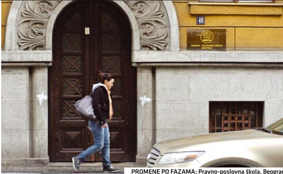
PROMENE PO FAZAMA: Pravno-poslovna škola, Beograd

Jedan od pokazatelja da stvari idu dobrim tokom jeste podatak da se 70 do 80 odsto maturanata poljoprivrednih škola zaposlilo tri meseca nakon što su dobili diplomu