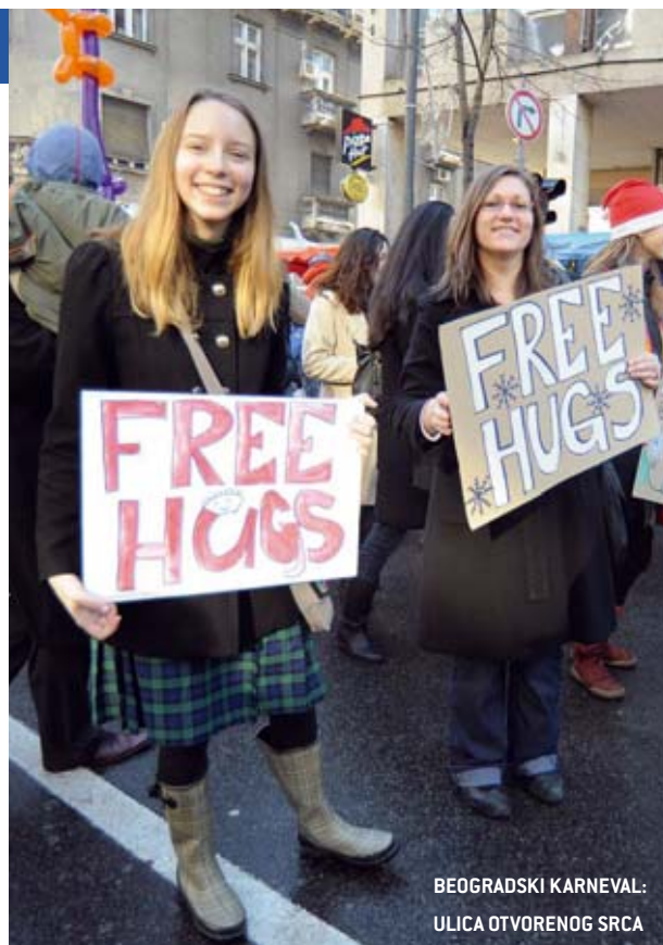
BEOGRADSKI KARNEVAL: ULICA OTVORENOG SRCA