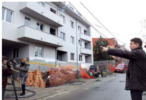
IMAMO NAMERU DA SPREČIMO BESPRAVNU GRADNJU: ZORAN KOSTIĆ

Uvidevši da su posle stupanja na snagu Zakona radovi na pojedinim gradilištima nastavljeni bez ikakvih papira, gradonačelnik Đilas je reagovao – zadužio je člana Gradskog veća Zorana Kostića da koordinira rad inspekcija gradskih opština (nadležnih za objekte do 800 kvadratnih metara) i Sekretarijata za imovinsko-pravne poslove i građevinsku inspekciju, nadležnog za objekte veće od 800 kvadrata. U prvih mesec dana utvrđeno je da se investitori ne obaziru na to što je Zakon stupio na snagu. “Gradonačelnik je poslao uputstvo predsednicima opština u kojem ih upozorava da građevinska inspekcija ne postu- u skladu sa Zakonom i preporučio kratke rokove da se što pre sprečila bespravna gradnja. Ako je prihva- 1 amandman, koji je tražio Grad Beograd, da se produži