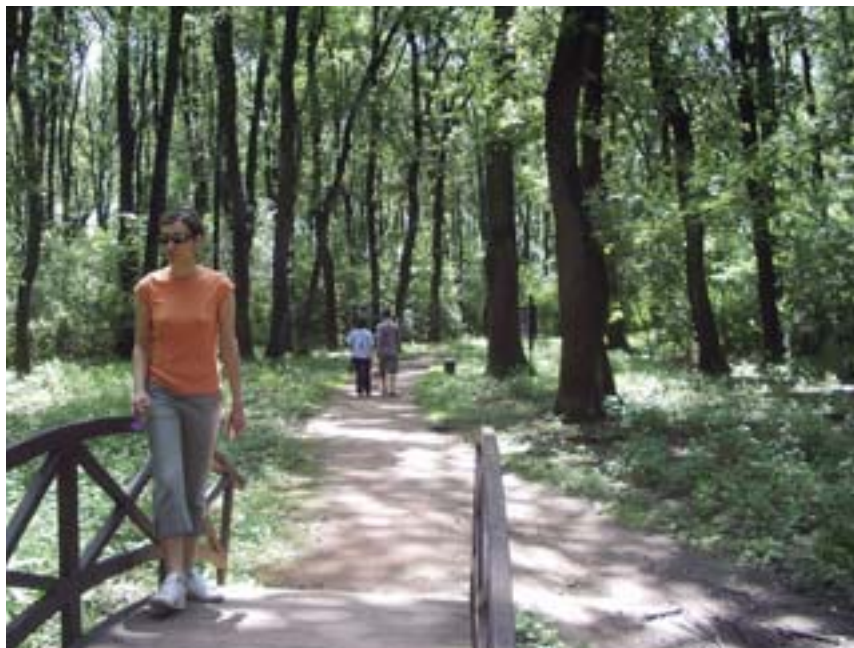
Trim staza u Zabranu