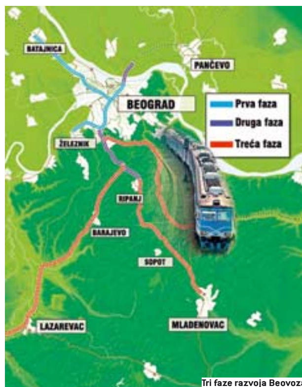
Tri faze razvoja Beovoza

“Potpisivanje Protokola i buduća saradnja sa Gradom za naše preduzeće su izuzetno značajni, jer su Železnice Srbije vrlo zainteresovane da železnički saobraćaj bude što kvali-