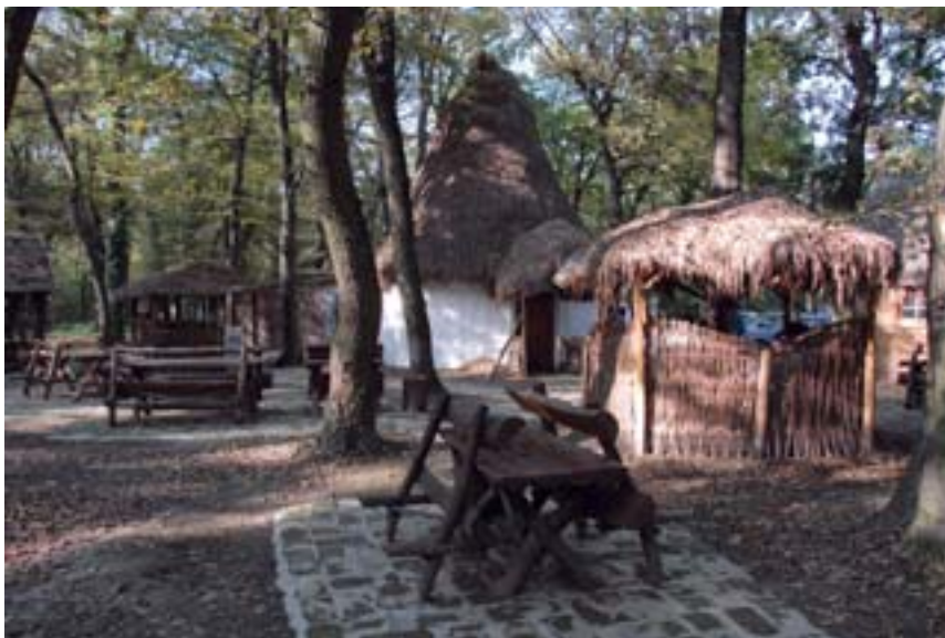
Bojčinska šuma: Bojčinska koleba i vožnja fijakerom