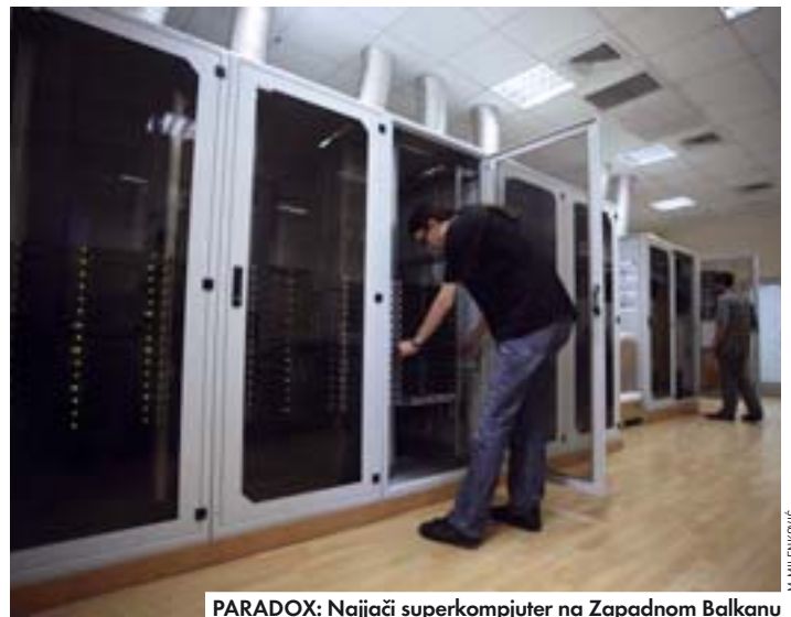
PARADOX: Najjači superkompjuter na Zapadnom Balkanu

Na skupu kompanije Cisco "ISP & cable event", koji je namenjen kablovskim i internet operatorima, uz nekoliko predavanja provajdera i kompanije Cisco, predstavljene su prognoze o budućnosti interneta po kojima će gotovo 64 odsto svetskog mobilnog protoka podataka u 2013. godini činiti video. Osim toga, prognozirano je da će svetski IP saobraćaj porasti petostruko do 2013. godine. Mobilni protok podataka će se do 2013. svake godine povećavati približno dva puta.