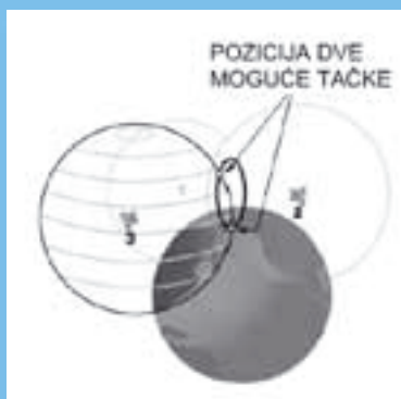
ODREĐIVANJE POLOŽAJA: Presek tri sfere