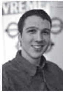
Piše: Mirko Đorđević

Na osnovu koncepcije seksualne selekcije koju je, inače, smislio Čarls Darvin (Darwin, 1871), seksualna selekcija se odigrava kada se jedinke neke populacije razlikuju u reproduktivnom uspehu i to zato što: 1. postoji rivalitet između jedinki istog pola (kod sisara su to najčešće mužjaci) u pristupu partnerima suprotnog pola, i 2. jedan pol (kod sisara su to ženke) pokazuje preferenciju (“aktivan izbor”) prema gametima nekih pripadnika suprotnog pola. Znači, seksualna selekcija je za Darvina bila mehani-