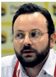
Piše: Stefan Aleksić

Dakle, utvara političke eksploatacije Prvog svetskog rata nije bila daleko ni ovog puta, jer se u izvesnom smislu istorija ponovila: ako je Prvi svetski rat bio onaj rat u kojem su u ime "nacionalnih interesa" stanovništva pozvana na solidarnost sa interesima političkih i eko-