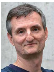
Piše: Ivan Milenković

Filozof i urednik Trećeg programa Radio Beograda