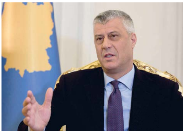
BESCILJNA LUTANJA: Aleksandar Vučić, Milo Đukanović i Hašim Tačić

svim onim o čemu je govorio pri obeležavanju završetka rata, a što svoj puni procvat doživljava u Srbiji. Neka izrazi neslaganje sa upravljanjem strahom, nasiljem i golom dominacijom. Ako je politika nove solidarnosti Unije izgledna i stvarna, onda bi to bio minimum kome možemo da se nadamo.