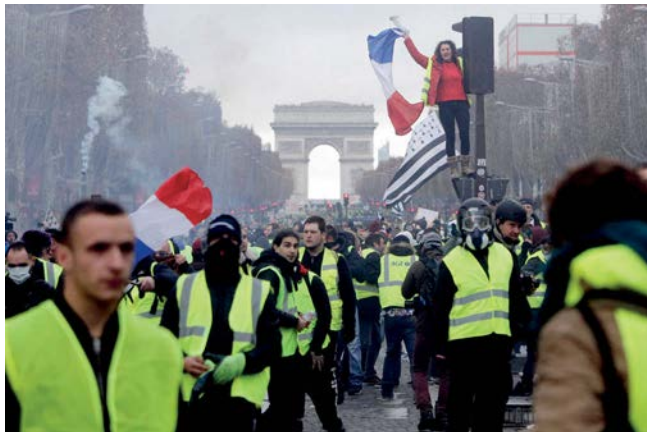
PARIZ GORI: Protesti u Francuskoj zbog cena goriva

problema demokratije”. Da, Angela Merkel, jedan od simbola trenutne neoliberalizacije Evrope i žustra zagovornica mera štednje, politika koje su ostavile duboko rodno obojene posledice svuda gde su primenjivane, sasvim ozbiljno govori: “Cilj je jednakost, jednakost svuda.” Činjenica da je savremena nemačka verzija Margaret Tačer u međuvremenu