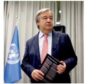
SUDBINA MIROVNOG PROJEKTA EU: Emanuel Makron, Angela Merkel, Antonio Gutereš

da misle o budućnosti i suštinskim stvarima. Krhkost mira i opasnost nacionalizma ukazuju da tragovi rata nikada nisu nestali. Stari demoni se ponovo dižu. Moramo pred našim narodima ponovo da potvrdimo svoju istinsku i ogromnu odgovornost,” poručio je Makron.