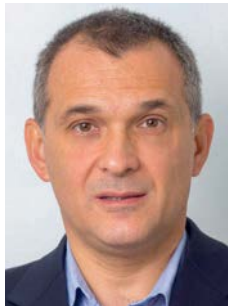
Piše: Vladimir Đurić

Jedan od primera na kojem se jasno vidi izostanak empatije jesu oboleli od bolesti zavisnosti i lica sa problemima iz domena mentalnog zdravlja. U našem društvu prečesto se može čuti stav da ova lica ne zaslužuju previše empatije i da im se solidarnost ne treba peterano ponuditi, čak ni kroz sistem zdravstvenog osiguranja, jer se radi o licima koja su svojim postupanjem sama doprinela stanju u kojem se nalaze. Bolesti zavisnosti za mnoge naše građane jednostavno nisu bolest, već isključivo samostalno i hirovito izabran stil života. Slično je i sa pripadnicima seksualnih manjina i sa mnogim drugim manjinskim društvenim grupama. Napro-