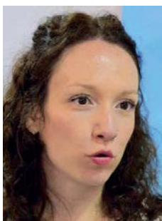
Piše: Sofija Mandić

U Srbiji nije bilo mnogo diskusije o onome o čemu je govorio Makron. Najsnažniji utisak iz Pariza bio je raspored sedenja na tribinama. Prema mišljenju domaćih vlasti i većine medija, Hašim Tači je zauzeo mesto koje je pripadalo srpskom predsedniku. Ono je, navod-