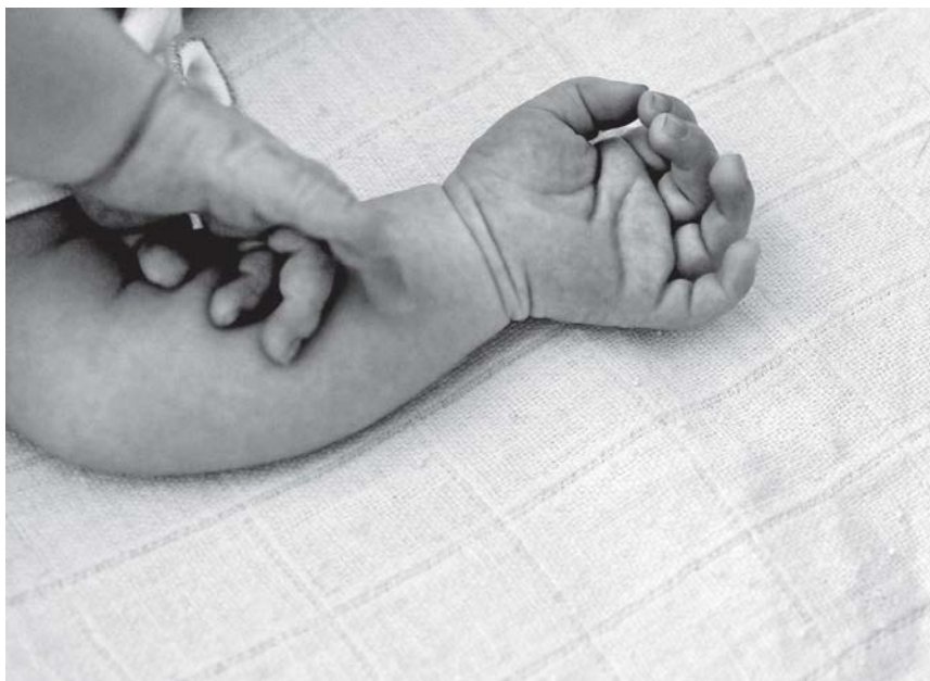
ČAK NI ZA DECU: Bez saosećanja

Nema razvijene demokratije bez razvijenih političkih stranaka. To je tako svuda u svetu i do toga će morati doći i srpsko društvo i njegov politički sistem. Revitalizovane i nove stranke sa razvijenim demokratskim kapacitetom, koje će konačno čuti građane koje predstavljaju, moraće da ponude odgovor do kojeg tek treba da dođemo kao društvo. Kroz njih će solidarnost građana i rad u javnom interesu dobiti pravi okvir. Rešenje je nova politička kultura. Ova potreba se oseća ne samo u Srbiji, već u celom svetu. Širom sveta građani su umorni od političkih elita koje nanovo traže svoje mesto pod suncem. Antipolitika nije srpski izum. Lake supstitute po-