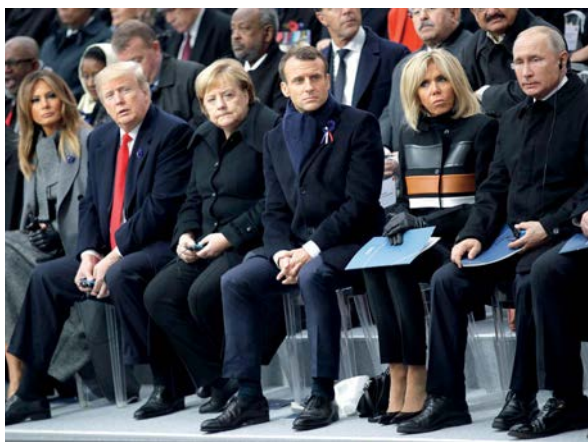
BEZ IDILIČNE EVROPE: Svetski lideri na Samitu u Parizu

Čini se da je najvažniji razlog odsustvo jedinstvenog evropskog identiteta. Nadnacionalna integracija u vidu Evropske unije očigledno nije dovoljno dobar okvir za postizanje solidarnosti. Pokazalo se da je nacionalna država i dalje najvažniji okvir u