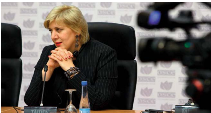
UVREDE NE TREBA SANKCIONISATI: Dunja Mijatović

“Da budem iskrena sa vama, preko glave su mi političari koji kažu da imaju problema sa govorom mržnje na njihov račun i da to mora da se prekine. To je kritikizam, i oni s time moraju da žive. To nije govor mržnje”, rekla je nedavno OEBS-ova predstavnica za slobodu medija Dunja Mijatović