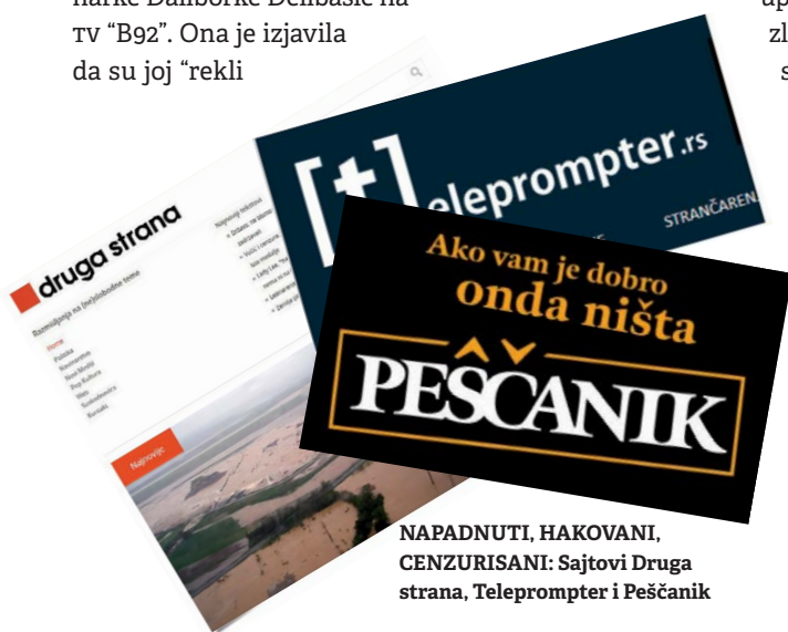
NAPADNUTI, HAKOVANI, CENZURISANI: Sajtovi Druga strana, Teleprompter i Peščanik