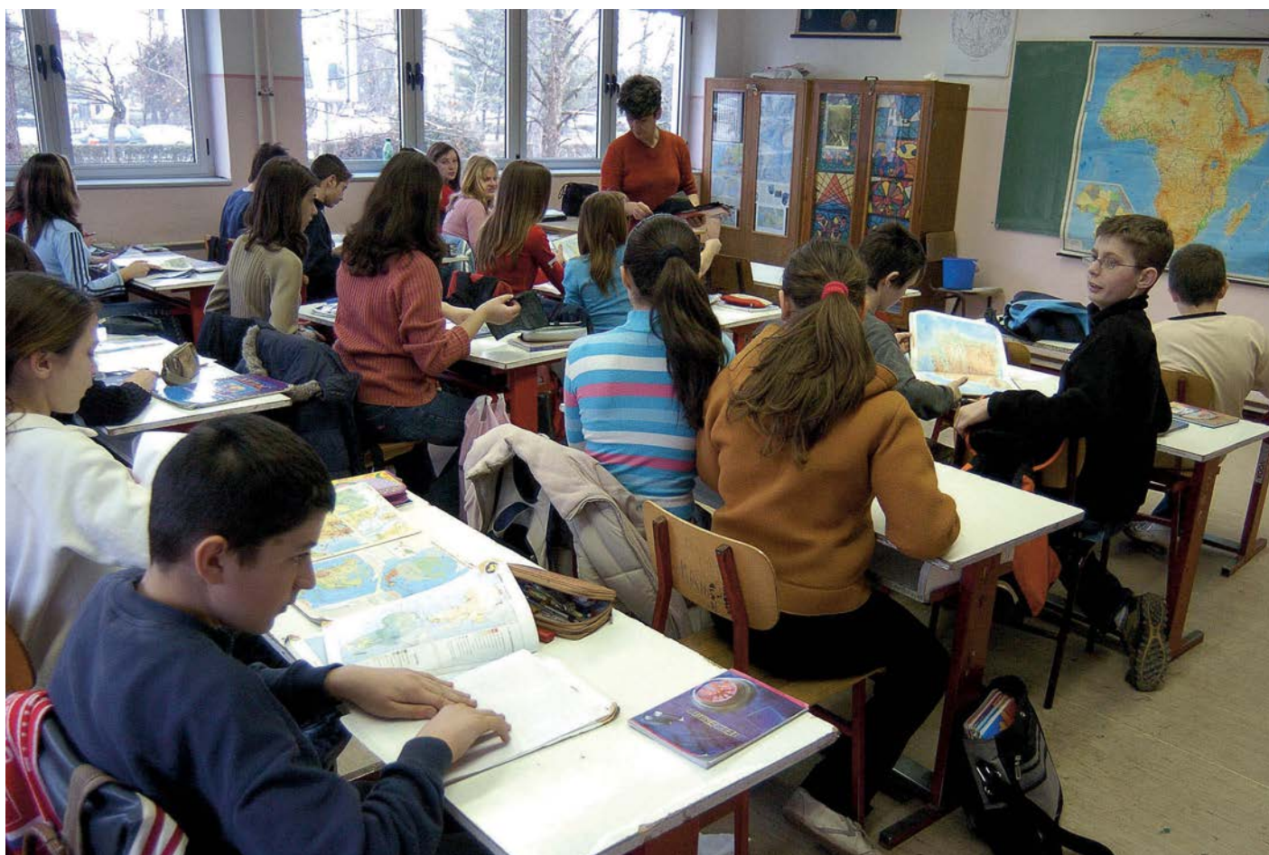
NIKADA U CENTRU REFORME: učenici

Takva matura nema nikakvog smisla, a kada saberemo sve posledice toga što nije održana na regularan način, učenik u obrazovnom sistemu Srbije najbližiji je izgubljenoj razelektrisanj čestici u nepreglednom haosu. Dugo su u stručnoj javnosti vođene rasprave o tome da li u