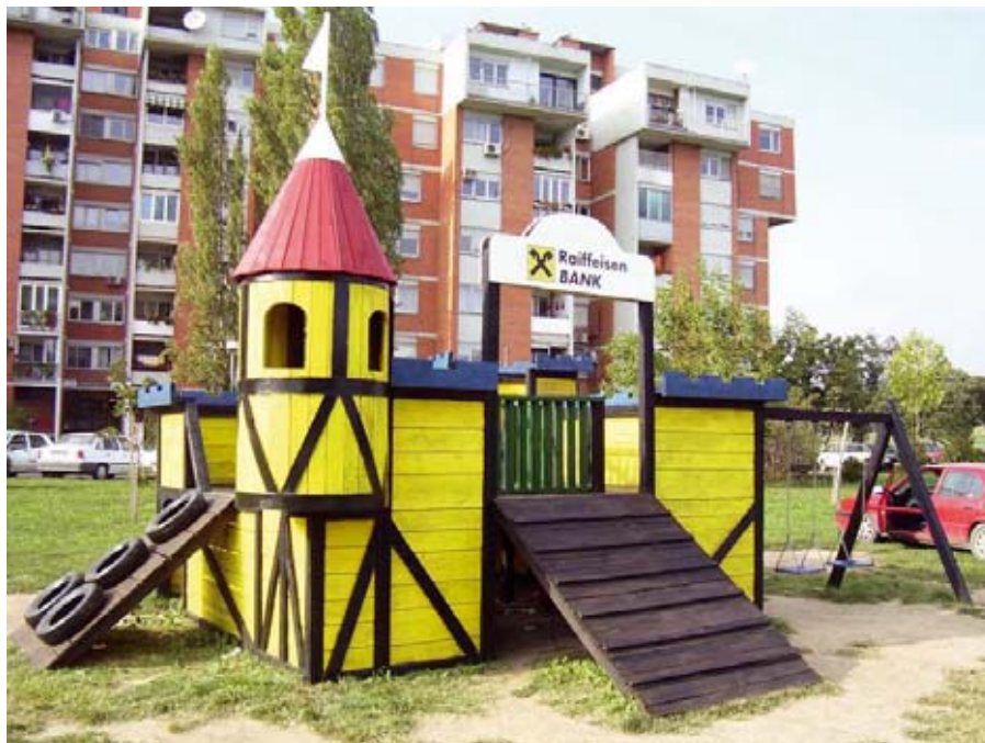
"Žuti parkići" izgrađeni su zahvaljujući Raiffeisen banci

TELETON I "ŽUTI PARKIĆI": U Raiffesen banci kažu da je tendencija da se podrška odnosi na najugroženije i najslabije delove zajednice, kao što su deca, bolesni i stare osobe, kao i odgovarajuće institucije koje ovim društvenim grupama pružaju zaštitu i pomoć. Ova banka već četvrtu godinu zaredom realizuje humanitarnu akciju "Teleton", u saradnji sa Radio-televizijom Srbije i Narodnom kancelarijom predsednika, a uz podršku Ministarstva prosvete. U okviru projekta, čija je priprema u toku, Raiffeisen banka će donirati sredstva u iznosu od 100.000 evra Sekretarijatu za dečju zaštitu grada Beograda