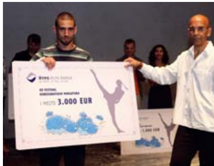
Podrška kulturi: Hypo Alpe Adria

BANKARSKA ETIKA: Pitanje bankarske etike posebno je aktuelizovala svetska recesija. Raiffeisen banka po pitanju fer poslovanja sledi jasno zacrtane principe koje je postavila grupacija i kojih se dosledno pridržava više od jednog veka. Posebnu pažnju posvećuju poslovnoj zajednici u kojoj rade, jer je vrlo važno uspostaviti etičku ravnotežu i poštovanje pravila tržišta, sa principom ostvarivanja poslovne dobiti. U tom smislu, odgovoran marketing, odnosno korektno oglašavanje uslova proizvoda i usluga banke, uz poštovanje važeće regulative i integriteta konkurencije, takođe predstavljaju važnu etičku dimenziju poslovanja Raiffeisen banke. U tom smislu, osnovni principi su transparentnost i etičnost u radu (koji se manifestuju kroz fer i korektan odnos sa klijentima, konkurentskim kompanijama na tržištu, kupcima i dobavljačima, kao i medijima i drugim zainteresovanim stranama), kvalitetna usluga i raznovrsna ponuda proizvoda, kao i konstantna briga o klijentima i stepenu njihovog zadovoljstva uslugom. Društveno odgovorno poslovanje, ističu u Raiffeisen banci, nije dodatna aktivnost, već je princip i kvalitet koji je ugrađen u same osnove poslovanja kompanije. Smatraju da je takav pristup imperativ