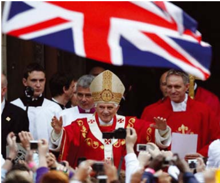
Papa Benedikt XVI u poseti Velikoj Britaniji

Ali već dugo se u Francuskoj nije radalo toliko monaških zvanja kao danas. I to onih strogih i kontemplativnih monaha. Hodočasnika u velikim centrima marijanskih svetili-