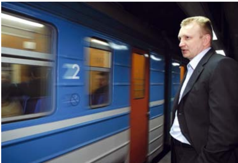
Proširenje mreže: Beovoz i gradonačelnik Dragan Đilas na železničkoj stanici Vukov spomenik